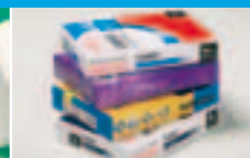
Упаковка для бумаги в пачках