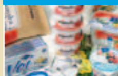
Laminaty barierowe na opakowania miękkie