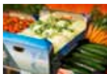
БАРЬЕРНЫЕ ЛАЙНЕРЫ ДЛЯ (ГОФРО)КАРТОНА