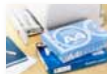
УПАКОВКА ДЛЯ БУМАГИ В ПАЧКАХ

Если вы заинтересованы в партнерстве с Walki, свяжитесь с нами через наш веб-сайт.